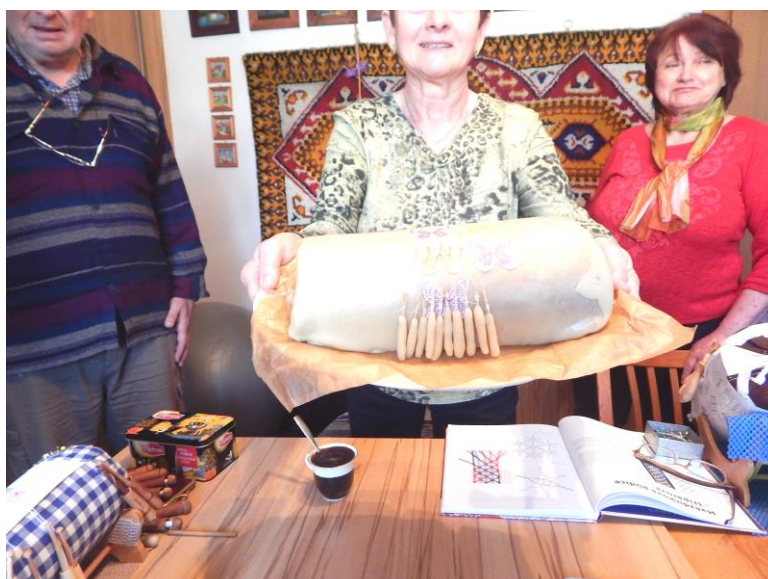
... pak dorazil dort.