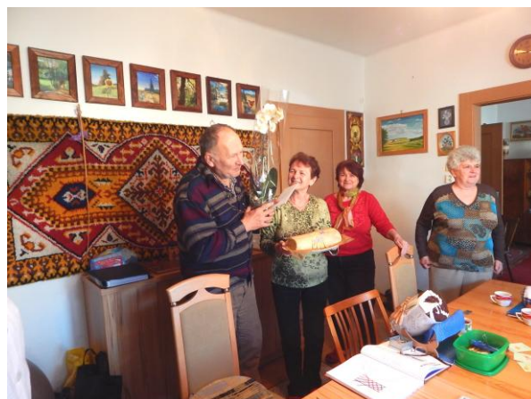
Nejdříve se řečnilo