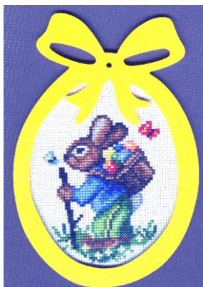
Výšivka od Libušky

Studentky se budou pilně věnovat koledníkům a rákoskou (nebo něčím podobným) tentokrát dostanou od nich.