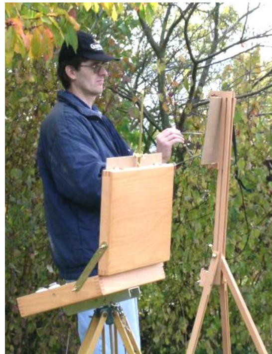
Z díla Dušana Zemana: