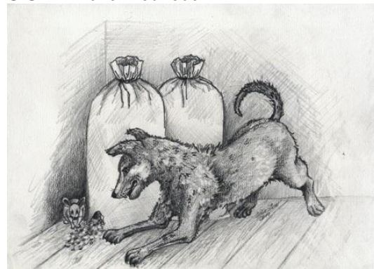
S.S.H: Ve mlýně SSH: Kotě na stromě