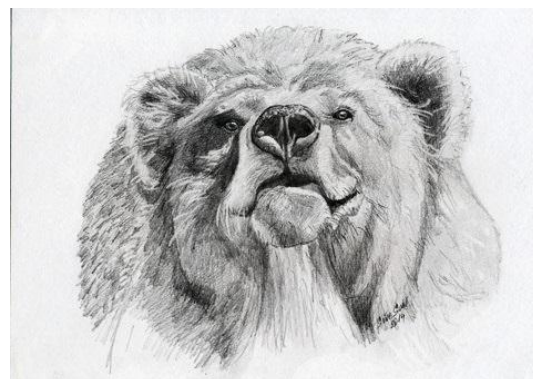
S.S.H: Hlava medvěda