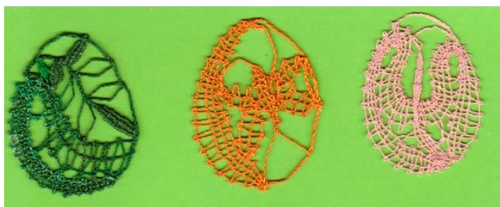
Iva: Nová vejce (část)