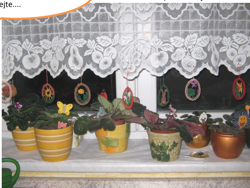
Iva: Velikonoční výzdoba

Pravdou je, že některé chystají (a některé jsou ve skluzu)