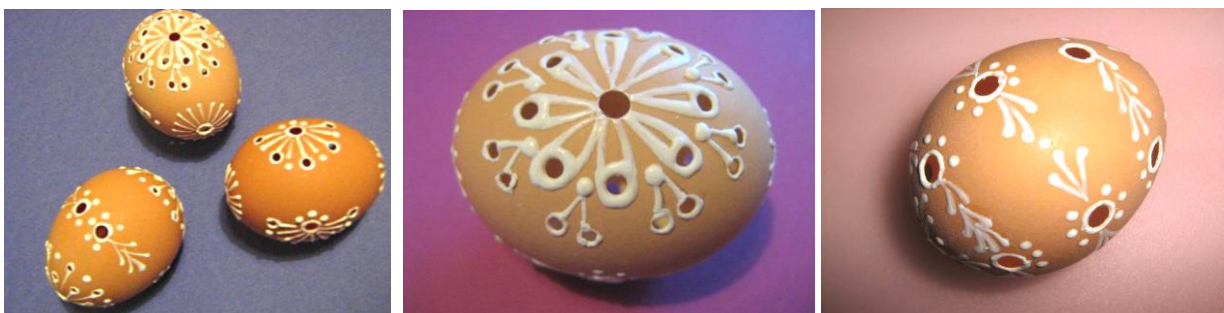
Helena (někteří jsou vrtáci, někteří si nechají vrtat koleno, ona vrtá díry do vajec... a nezvrtá to)