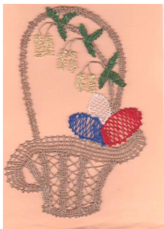
Iva: Koš vajec