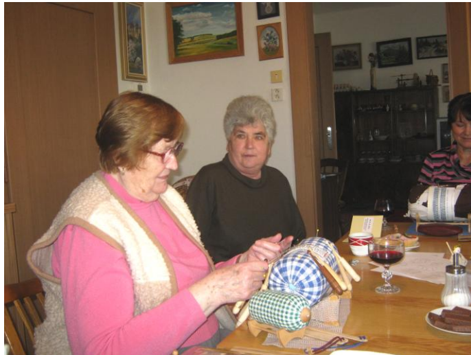
To šla potom práce pěkně od ruky.