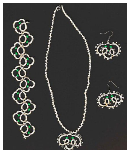
Helena (frivolitková souprava)

Starší čísla Drbodaje jsou dostupná z adres: