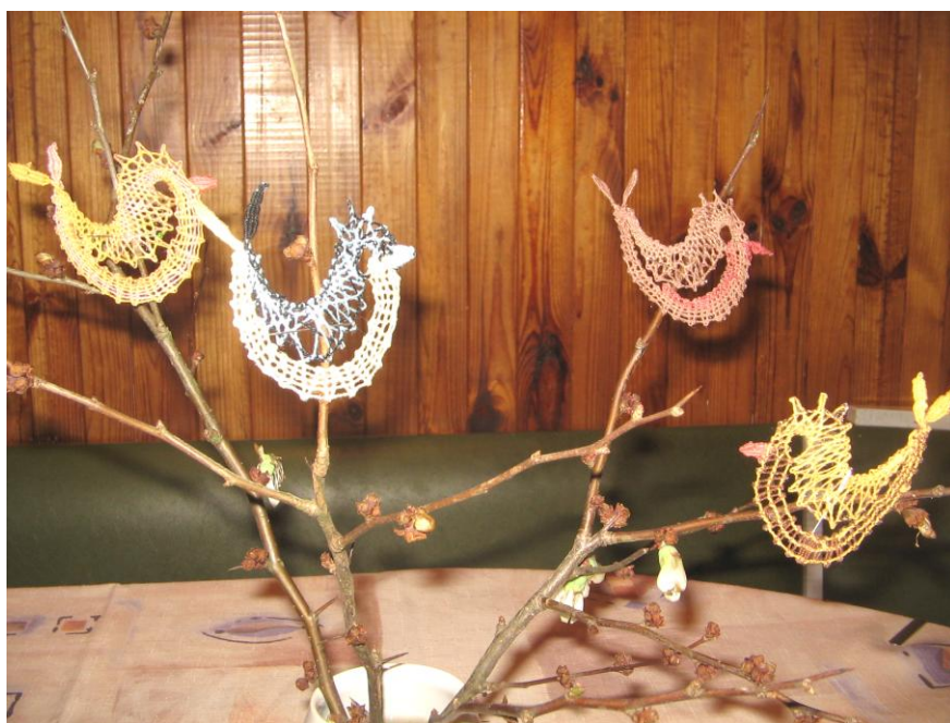
Iva: Velikonoční výzdoba