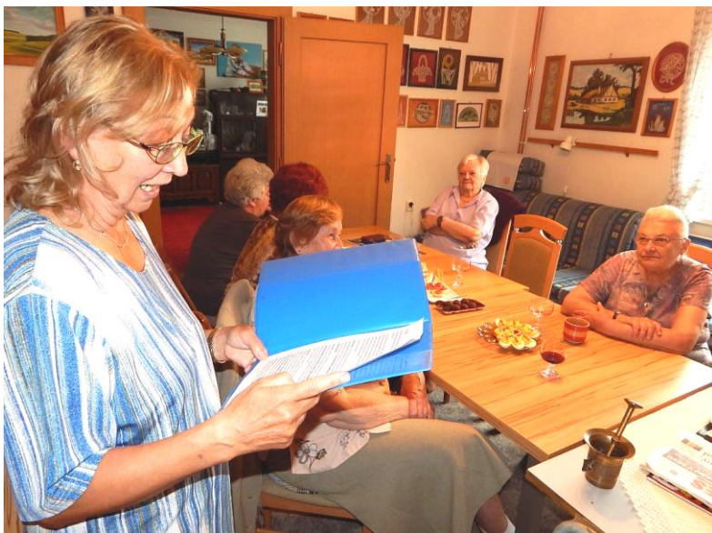
Obhájkyně ex-offo Helena Š.

řádný, ba přímo příkladný, život a i když velkou část svého pracovního života pracovala na pile, nikdy nedopustila, aby jí tam někdo přeřízнул. A kdo někdy pracoval v mužském kolektivu, dokáže patřičně tuto skutečnost ocenit.