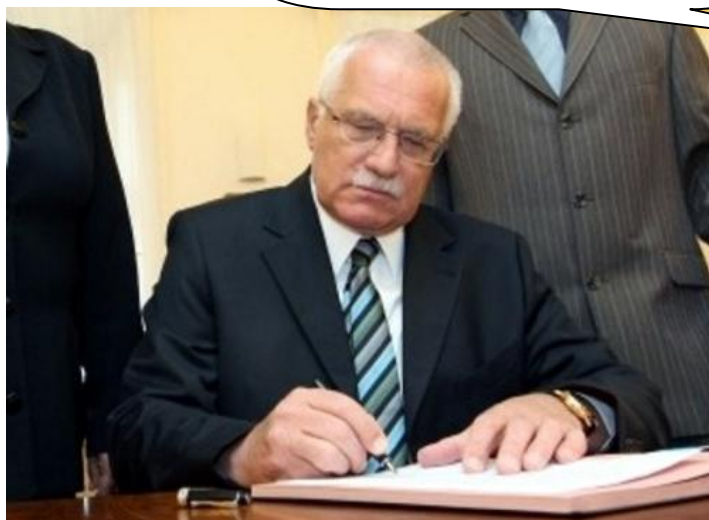
Prezident podepisuje zákon.

Mé milé krásné dámy! Právě jsem se vrátil z Hradu. Pan prezident všechny moje návrhy přijal.