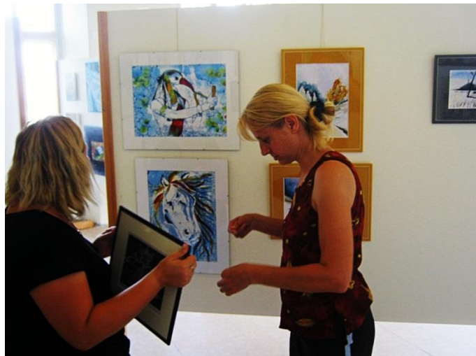
Instalace do galerie