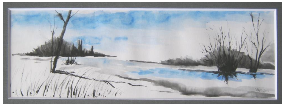
Ukázky obrazů Anny Vršecké