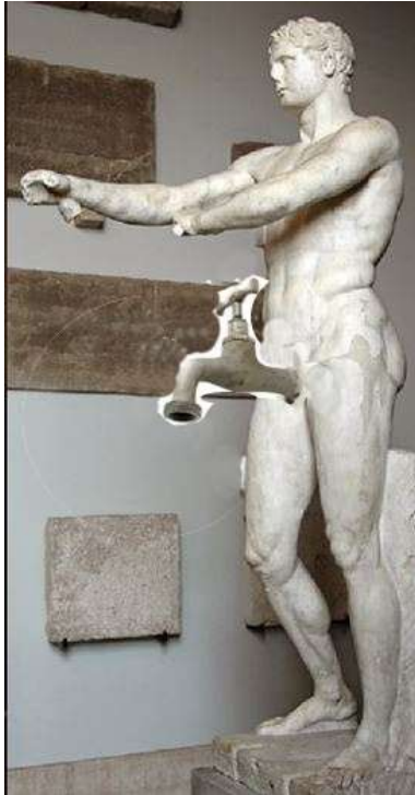
Pohlaví č. 8