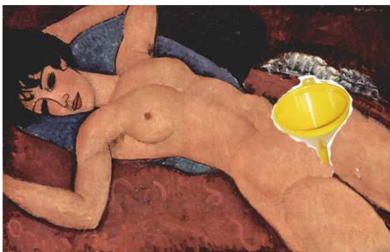
Pohlaví č. 5 Nálevnice

Naši známí lékaři a odborníci z více medicínských oborů (gynekolog, ornitolog a psychiatr) tvrdí, že za svůj profesní život poznali jen dvě pohlaví. Redakční špehové a zpravodajové tedy vyrazili do ulic (pochopitelně jen Prahy, tušili, že jinde šanci nemají), aby zjistili, jestli těch pohlaví není přece jenom více. Jejich snažení bylo korunováno úspěchem a ten umělecky zdokumentovali: