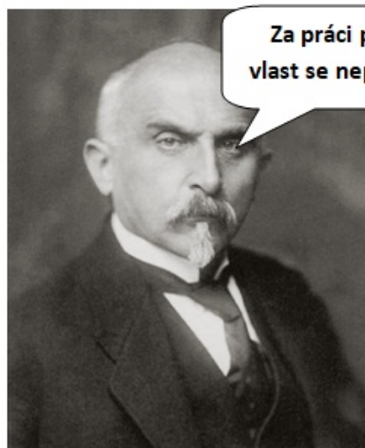
JUDr. Alois Rašín