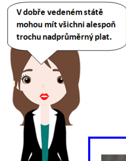
Studentka Vyšší zdravotnické školy

V dobře vedeném státě mohou mít všichni alespoň trochu nadprůměrný plat.