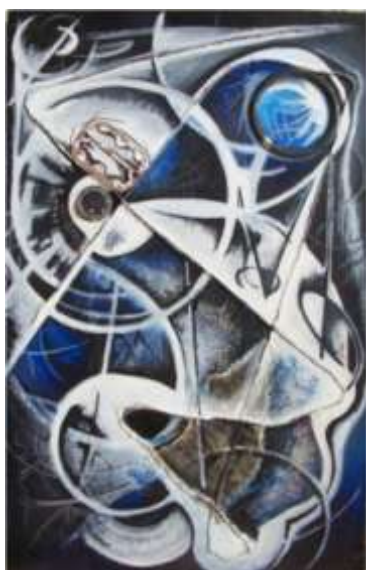
Bez názvu (2x)