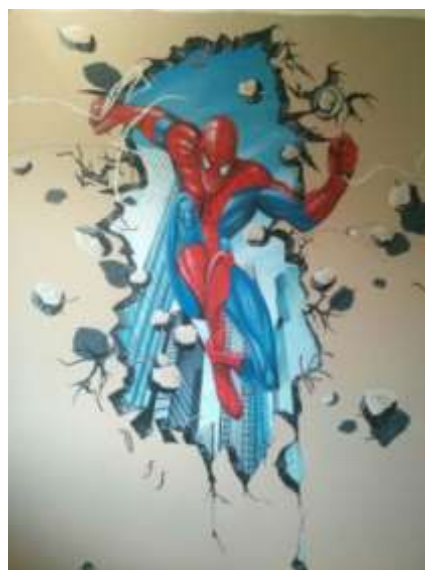
Malba do dětského pokoje