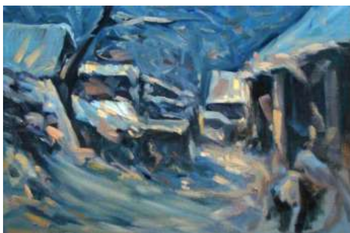
Emil Horský : Tonight