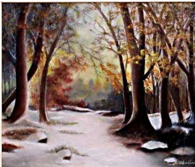
Míla Sklenářová : Zimní les