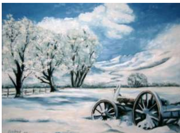
Petr Černoch : Starý vůz