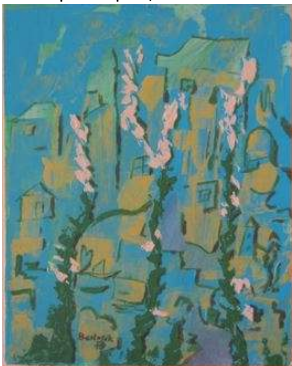
Jiří Chorche Bartošík : Zimní nálada

Máme čas (pro křesťany) adventní, (pro neznabohy) předvánoční (pozn. redakce: vánoce slaví i neznabozi), a proto přijměte malou obrazovou pozvánku do zasněžené krajiny, než nám tady muslimáci zavedou písečnou poušť, zakážou vánoce a Ihaní ČT nahradí hulákáním z minaretů: