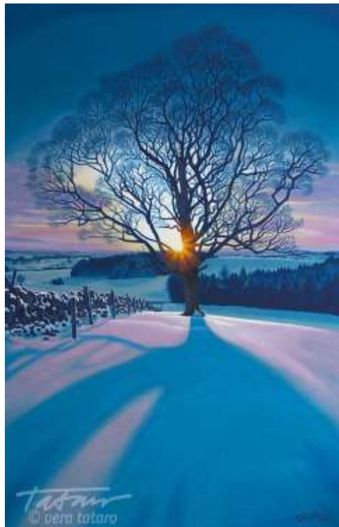
Věra Tataro : název neuveden