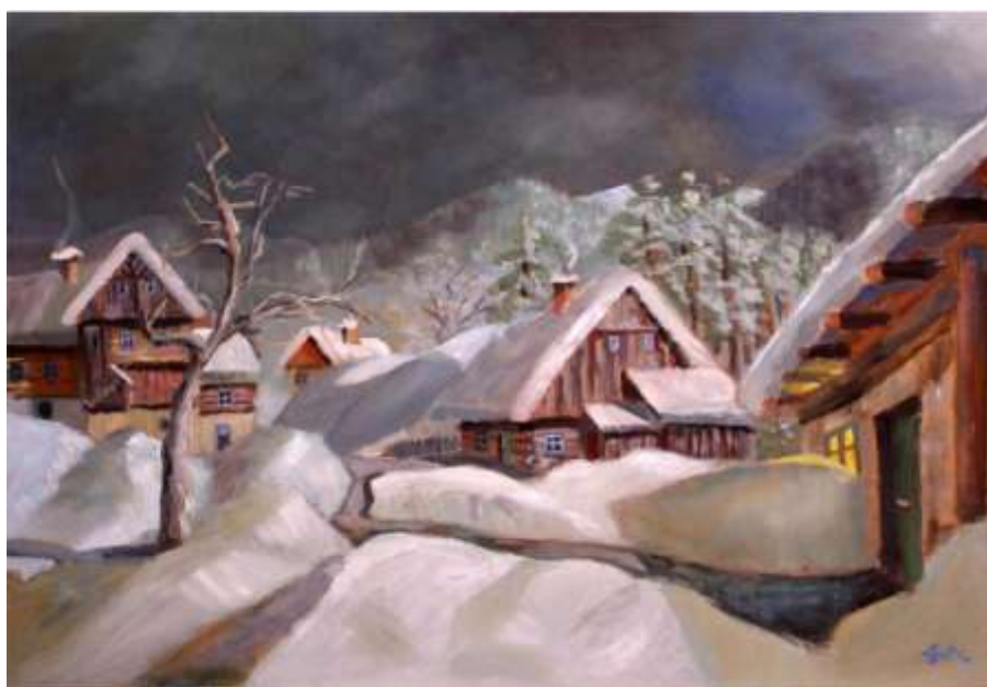
Věra Wunderlichová : Noc plná kouzel