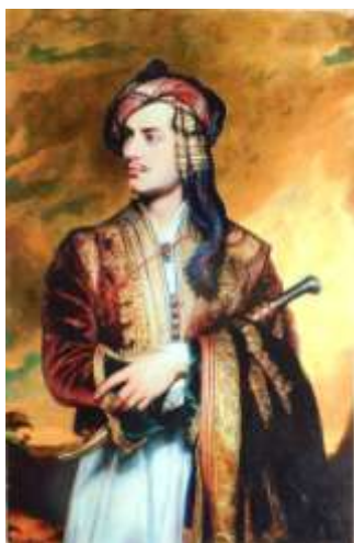
Ali Baba Temelínský pardon Ali Paša Tepelenský zamlada, lupič, vrah,... národní hrdina

Hloupý český Honza zase jednou vyrazil do světa, a nestačil se divit. Navštívil krásnou a trochu zapomenutou zemi, jejíž hrdí obyvatelé, Skipetáři, pořád proti někomu bojovali, poněvíc sami proti sobě, nepochopili ani komunismus, ani kapitalismus, a nakonec si vybojovali právo zůstat chudí, protože ti chytřejší je opouštějí a odcházejí do ciziny. Celé povídání, z něhož je vzat následující úryvek, najdete ZDE :