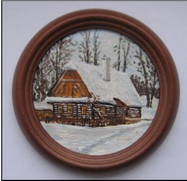
Ukázka z miniatur Jiřího Frýdy

přechodů do stínů, barvy po povrchu nekloužou a výborně se maluje technikou frottage, tj. suchým štětcem do ztracena. Při použití tenkých vrstev lazuru nám křídově bílý podklad položenou lazuru doslova rozzáří. Malba na tento podklad je doslova potěšením. Uvidíte, že po vyzkoušení mi dáte za pravdu a odfláknuté akrylové šepsy s radostí vyhodíte, jelikož je to jenom slabá náhražka a i větší pracnost křídového podkladu vás neodradí, protože výsledek je nesrovnatelný. Pokud budete mít nějaký dotaz, obraťte se na mně, rád vám poradím. Pokud někdo z vás bude mít zájem, poradím s