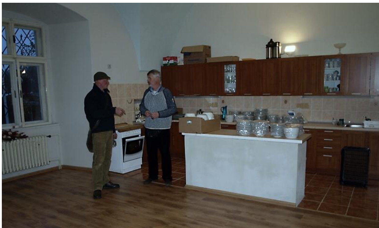
Kuchyňka – doufám, že už se Vám sbíhají sliny 😊 (mně ano, ale u mne je to setrvalý stav)

Dají také dle našeho návrhu do pořádku výstavní místnost - výmalba, osvětlení, lišty (ať to tam trošku lépe vypadá pro návštěvníky zámku ) + info o obrazech, názvy, jména, ceny. Musí se dát dohromady nějaký katalog (to už bude spíše naše záležitost).