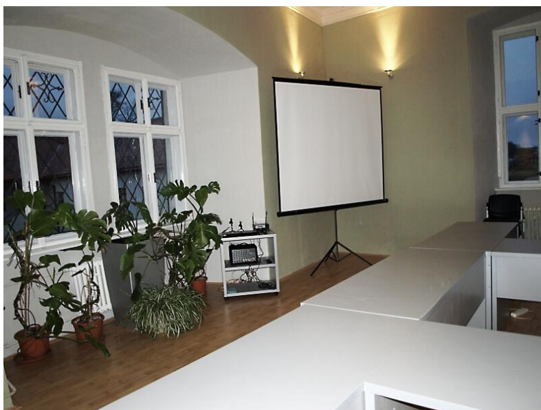
Nový přednáškový sál. Tam se (mi) to bude žvanit... ☺. Nemyslete si, bando upatlaná, že to tam upatláte modří ultramarínovou, černí kostní a pobryndáte lněným olejem!