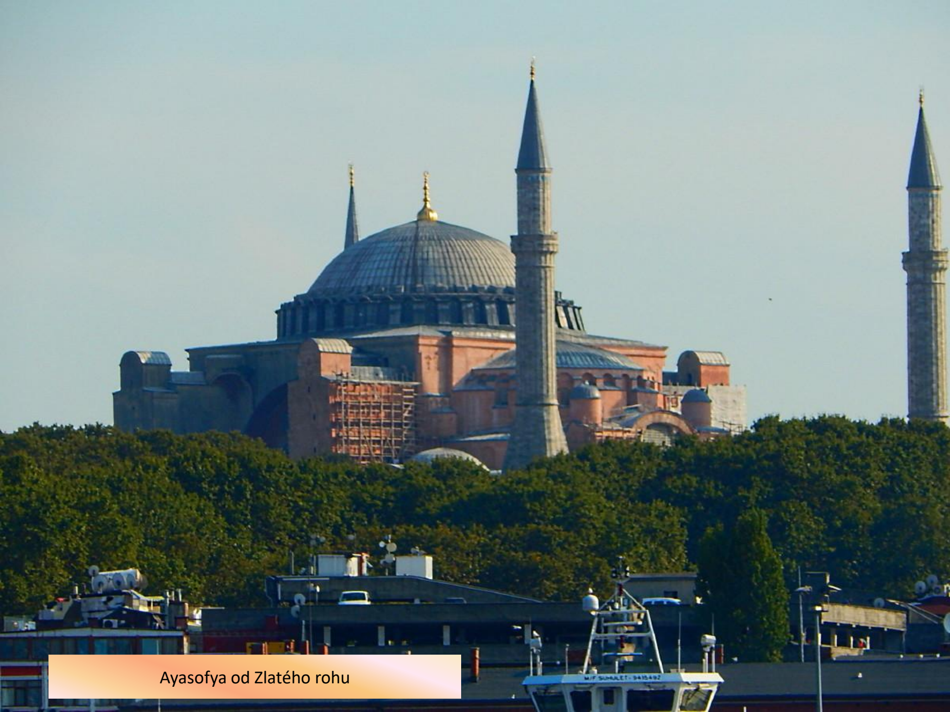
Ayasofya od Zlatého rohu