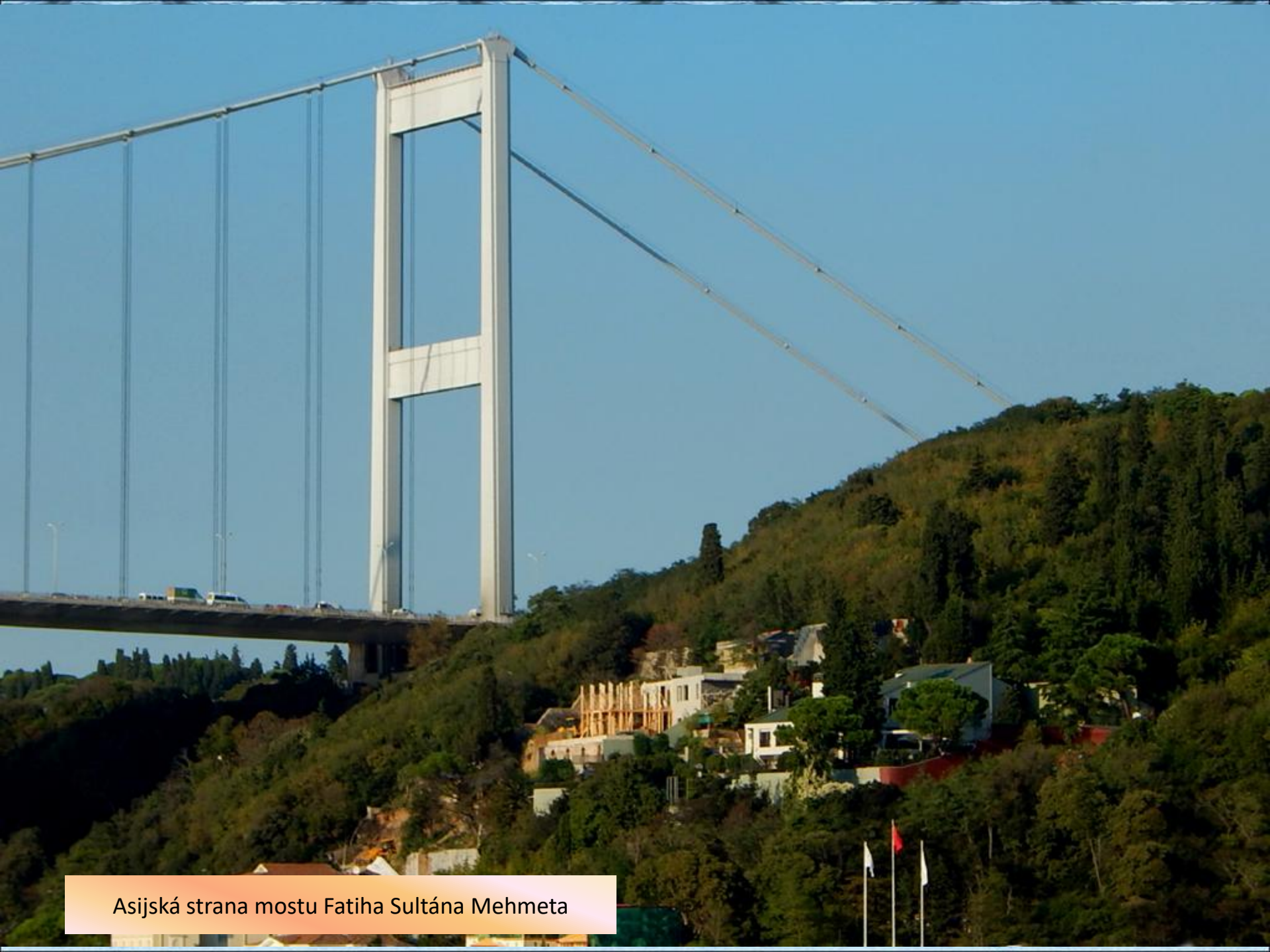
Asijská strana mostu Fatiha Sultána Mehmeta