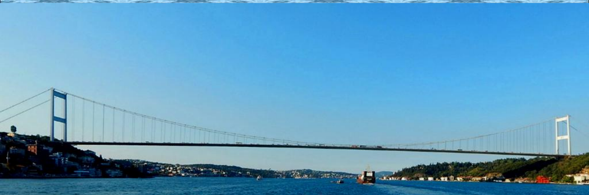
Druhý most přes Bospor - Most Fatiha Sultána Mehmeta. Délka 1090 m, otevřen v r. 1988.