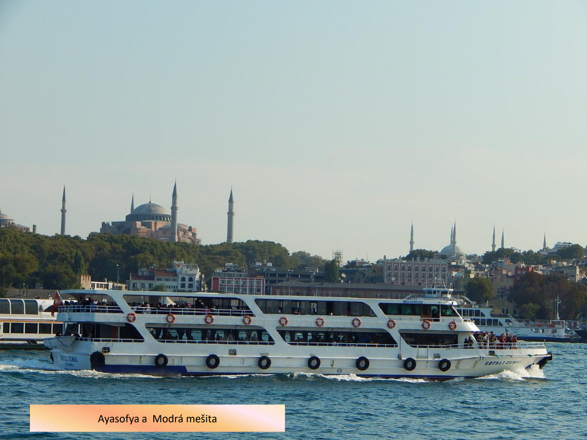
Ayasofya a Modrá mešita