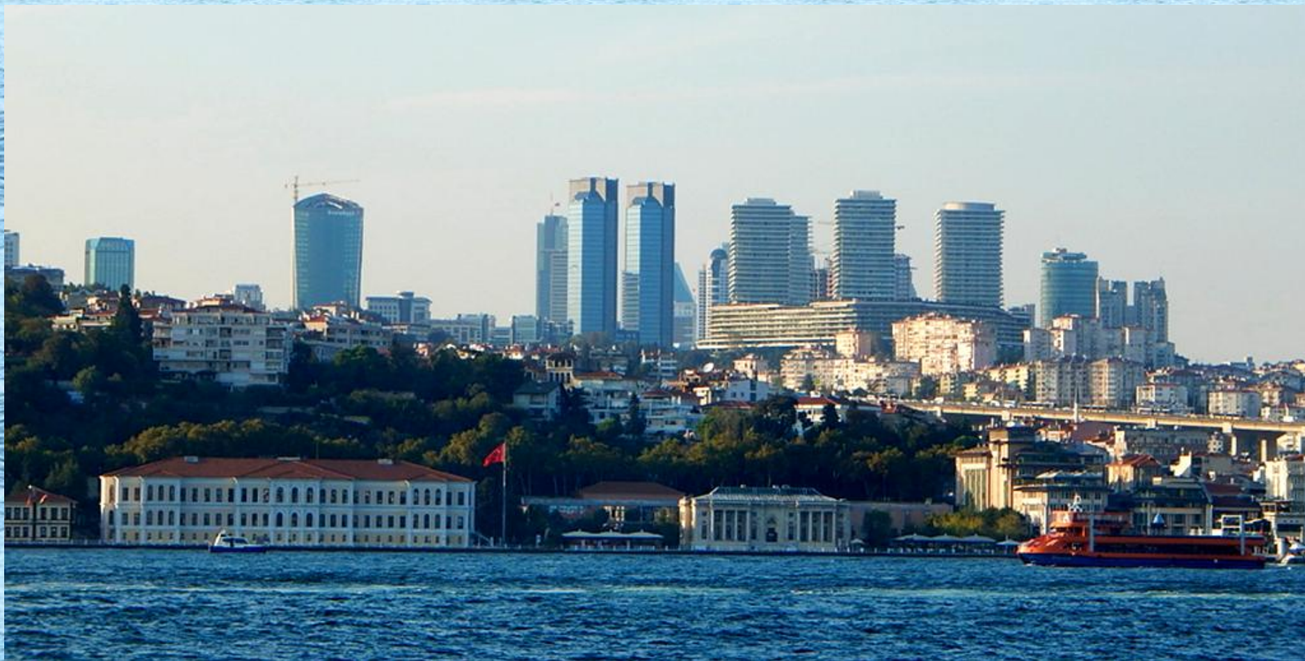
Evropský konec bosporského mostu