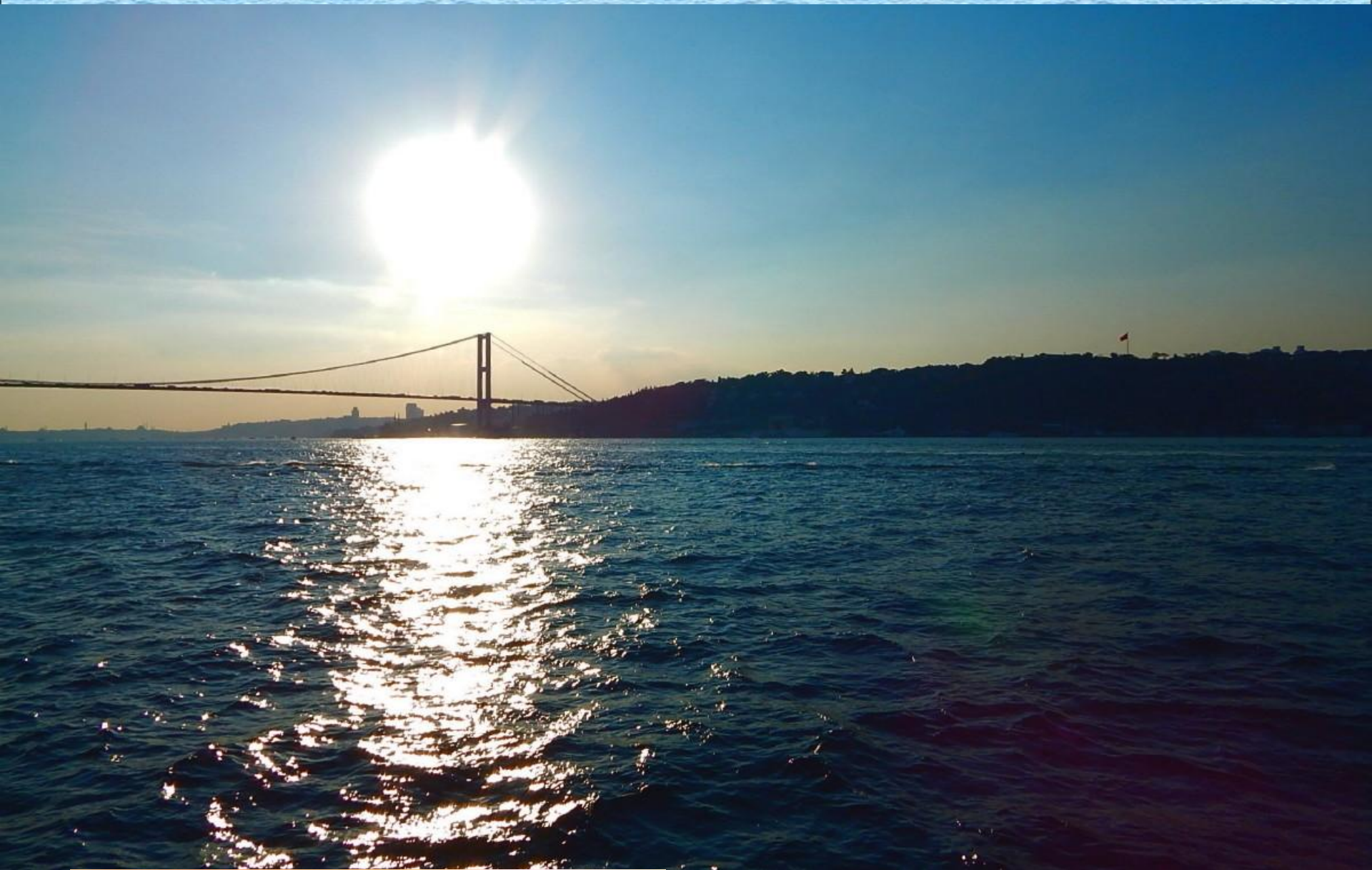
Západ slunce nad bosporským mostem