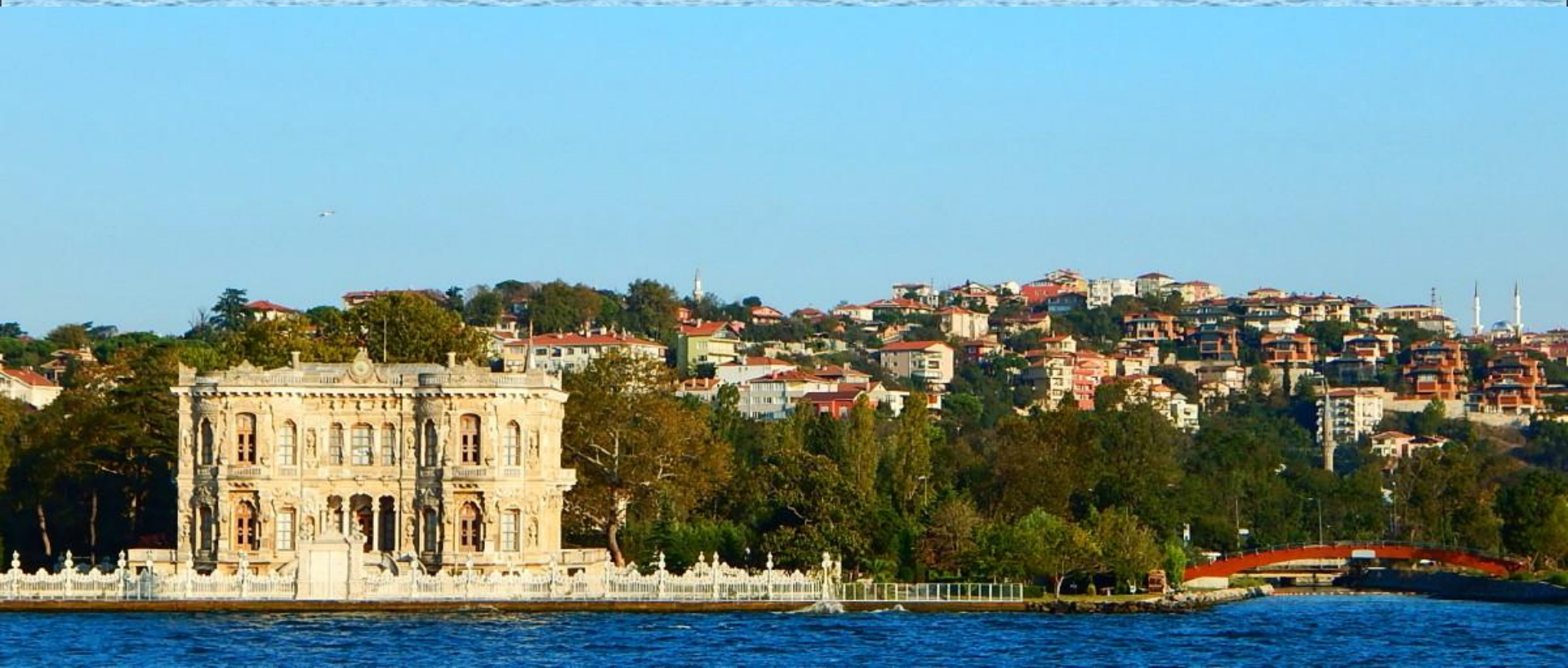
Palác Küçükseki Kasrı (1856)