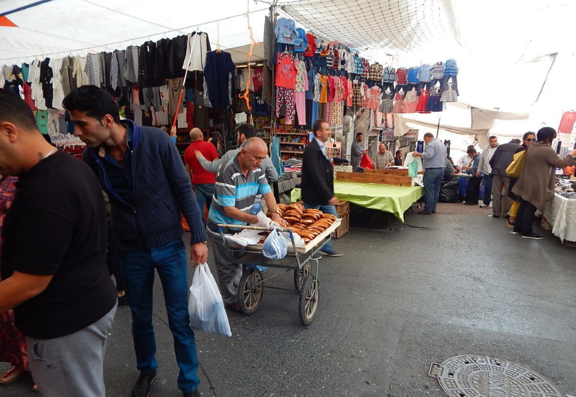
Prodej preclíků – simit. Fakt jsou dobré.