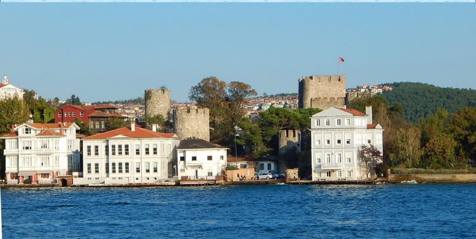
Asijský břeh Bosporu se starými hradbami.