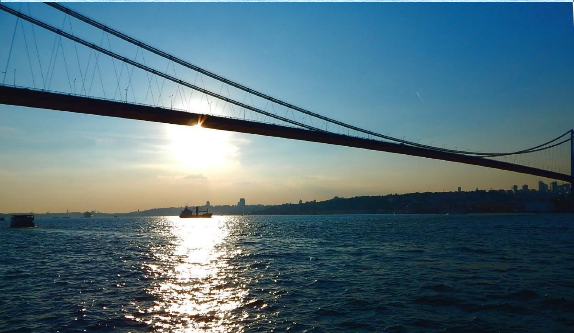
Západ slunce nad bosporským mostem