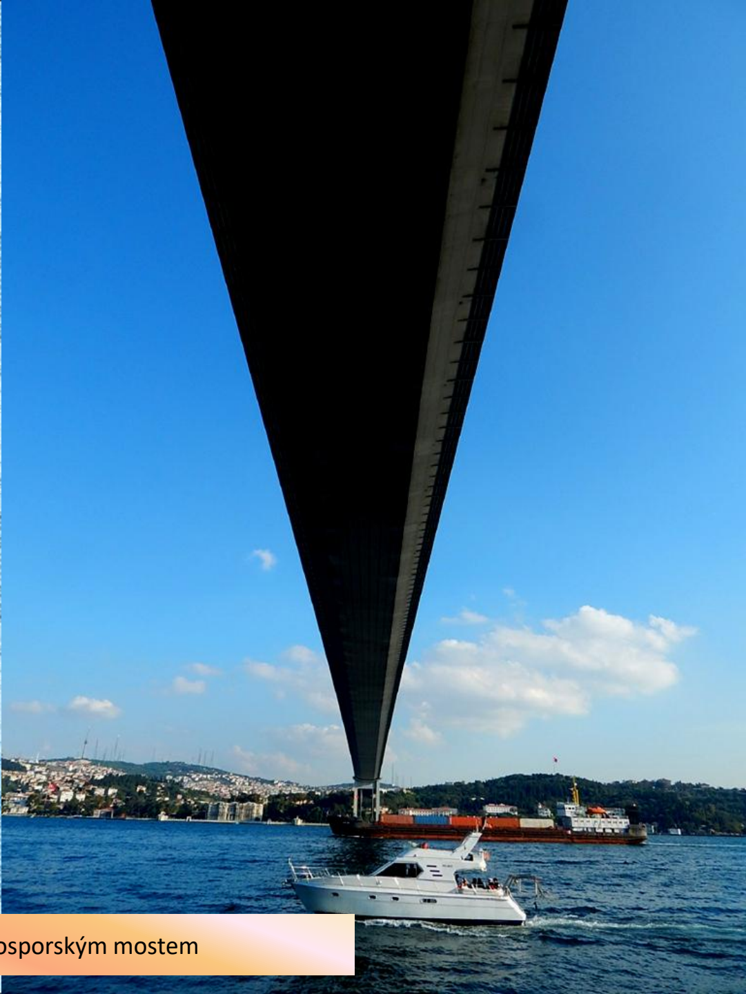
Pod bosporským mostem