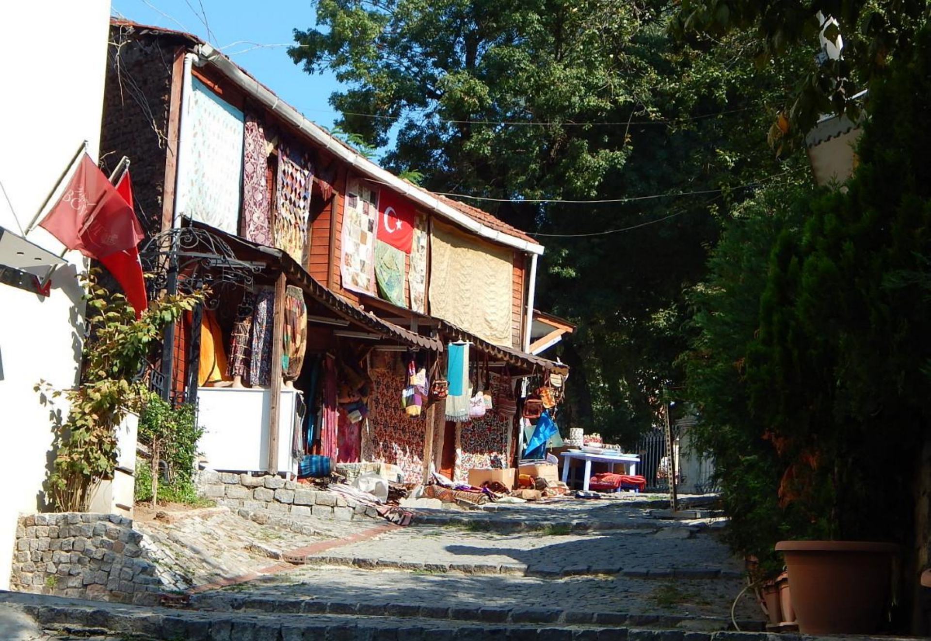
Čtvrť Ahmetsultan. Zde jsou ještě k vidění (mizející) pozůstatky starého Istanbulu.