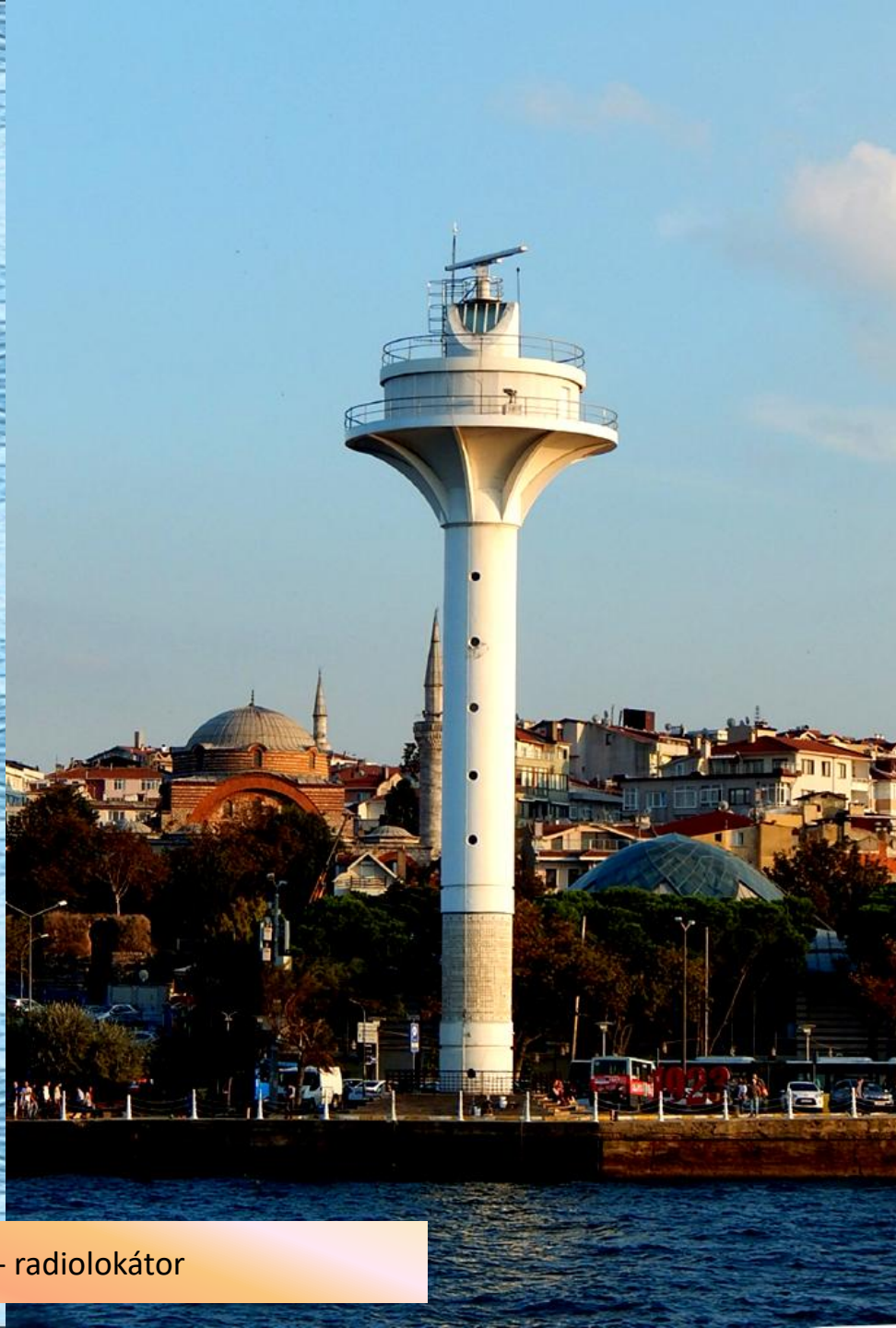
Majak - radiolokátor