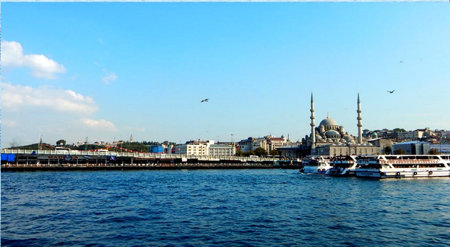
Galatský most a Nová mešita