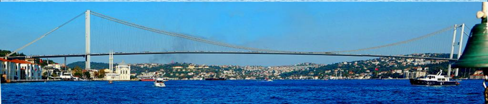
Panoramatický pohled na most přes Bospor. Délka 1074 m, postaven v r. 1973