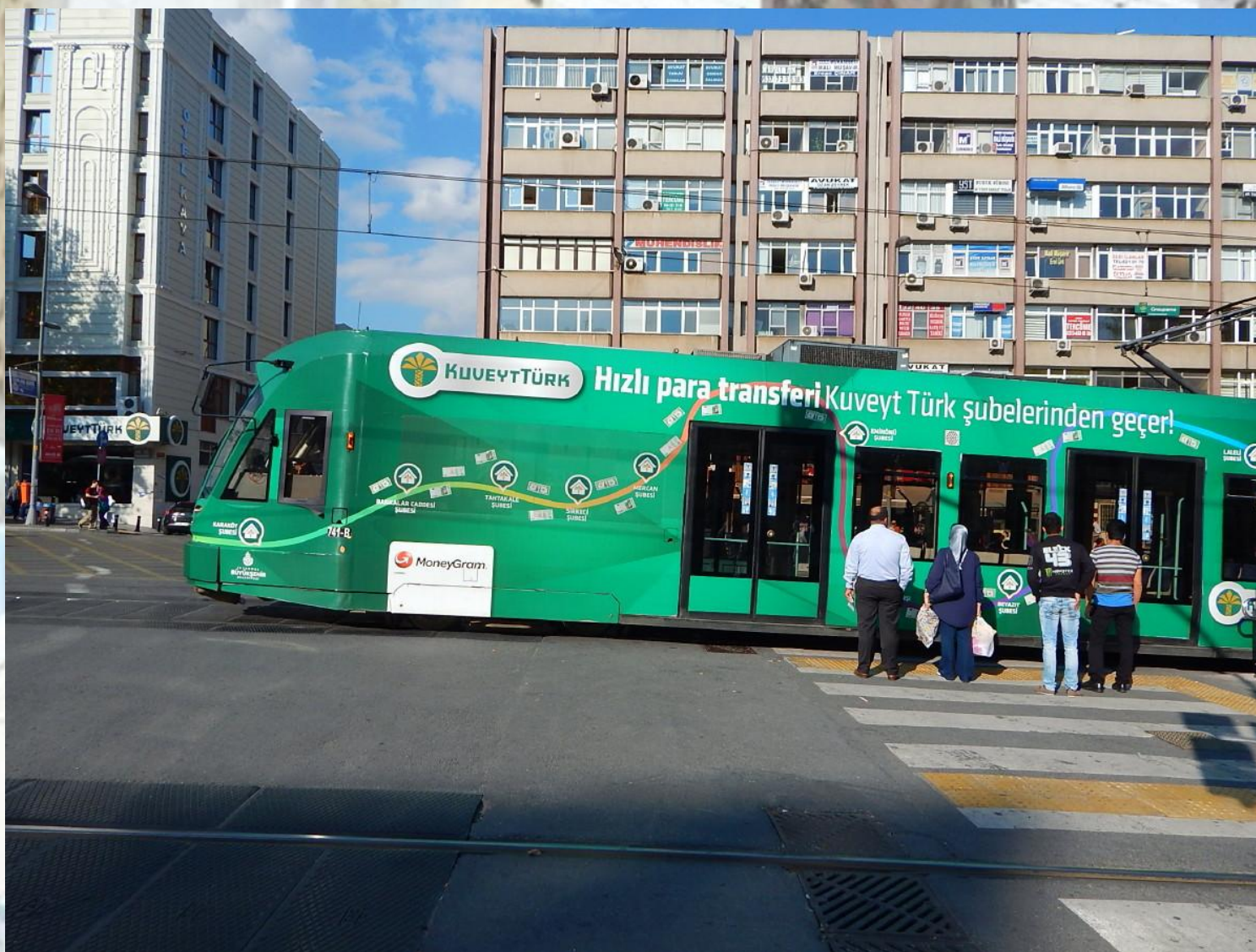
Tramvaje v Istanbulu jsou jednak velice moderní, kloubové a dlouhé, jednak pestře pomalované reklamou.