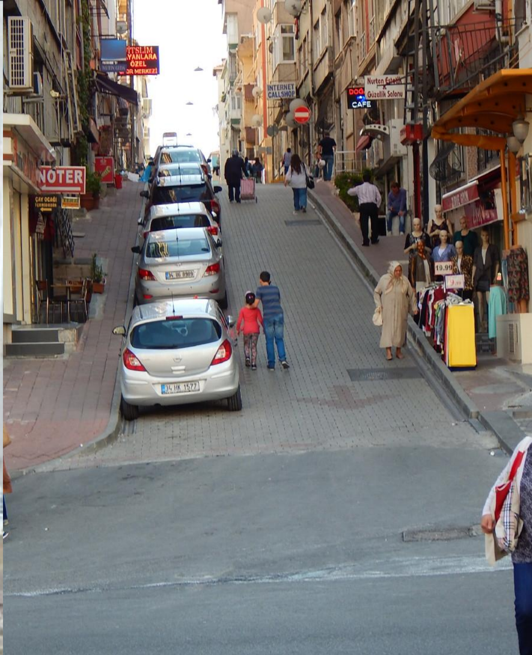
Ulička ve Findikzade poblíž hotelu Kaya