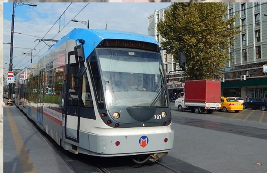
Další ukázky tramvají