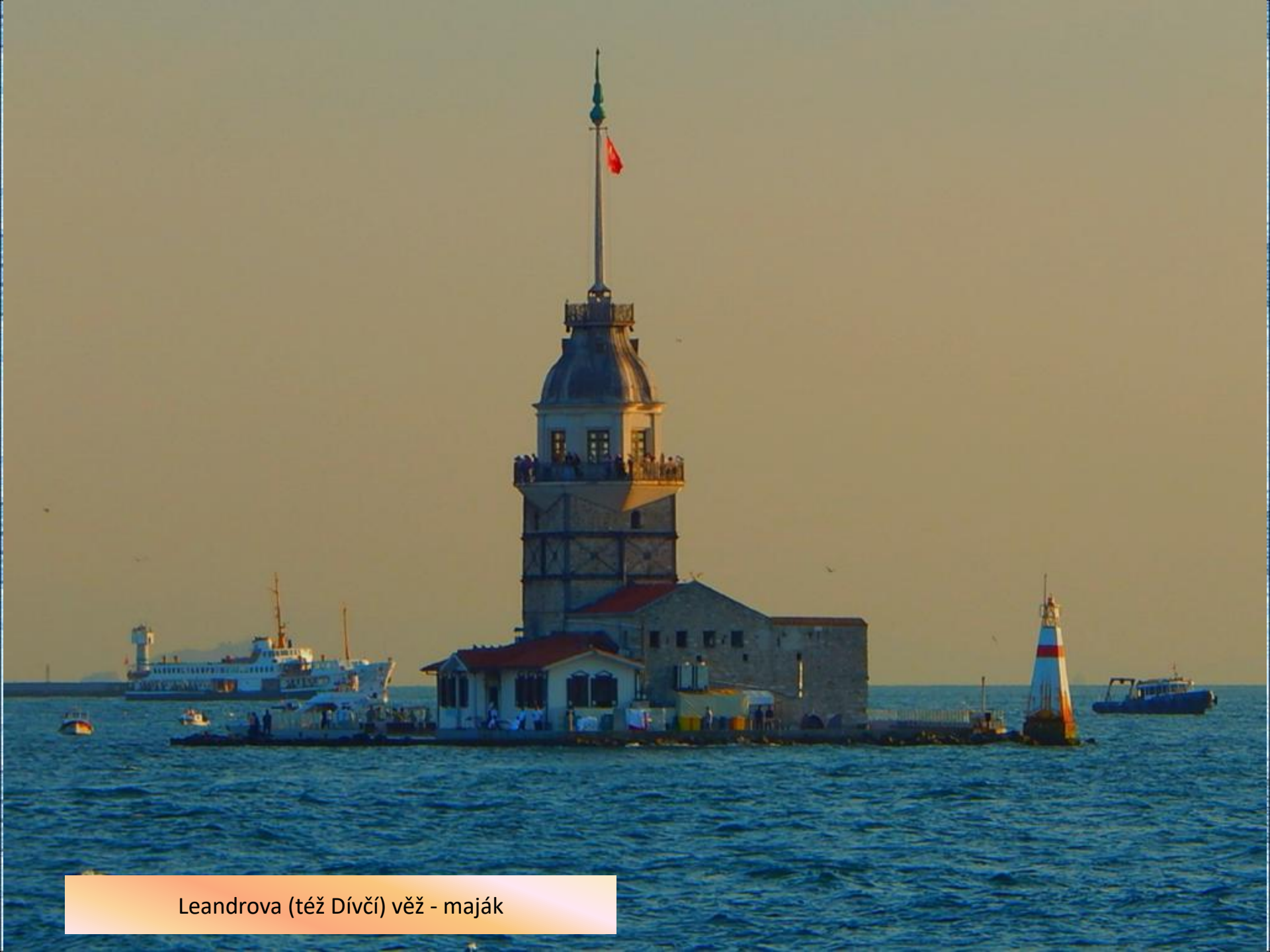
Leandrova (též Dívčí) věž - maják