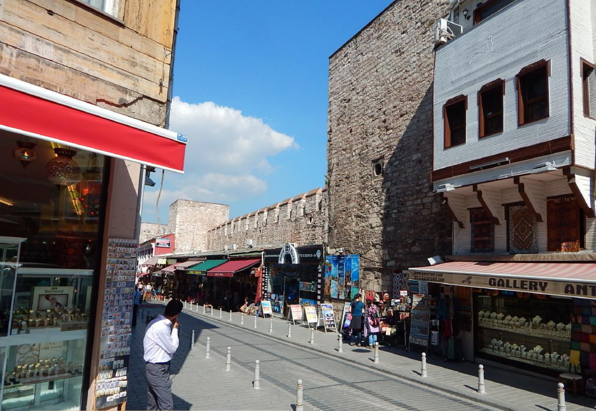
Krámký u starých hradeb.