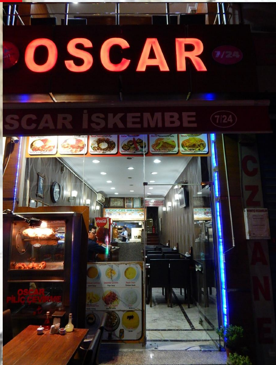
Nasvícený gril má vybudit chuť kolegjdoucích.