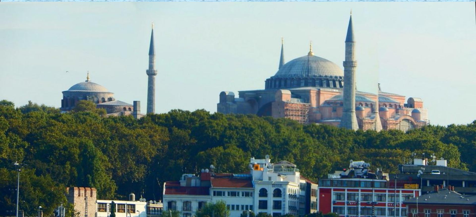
Hagia Irene a Ayasofya