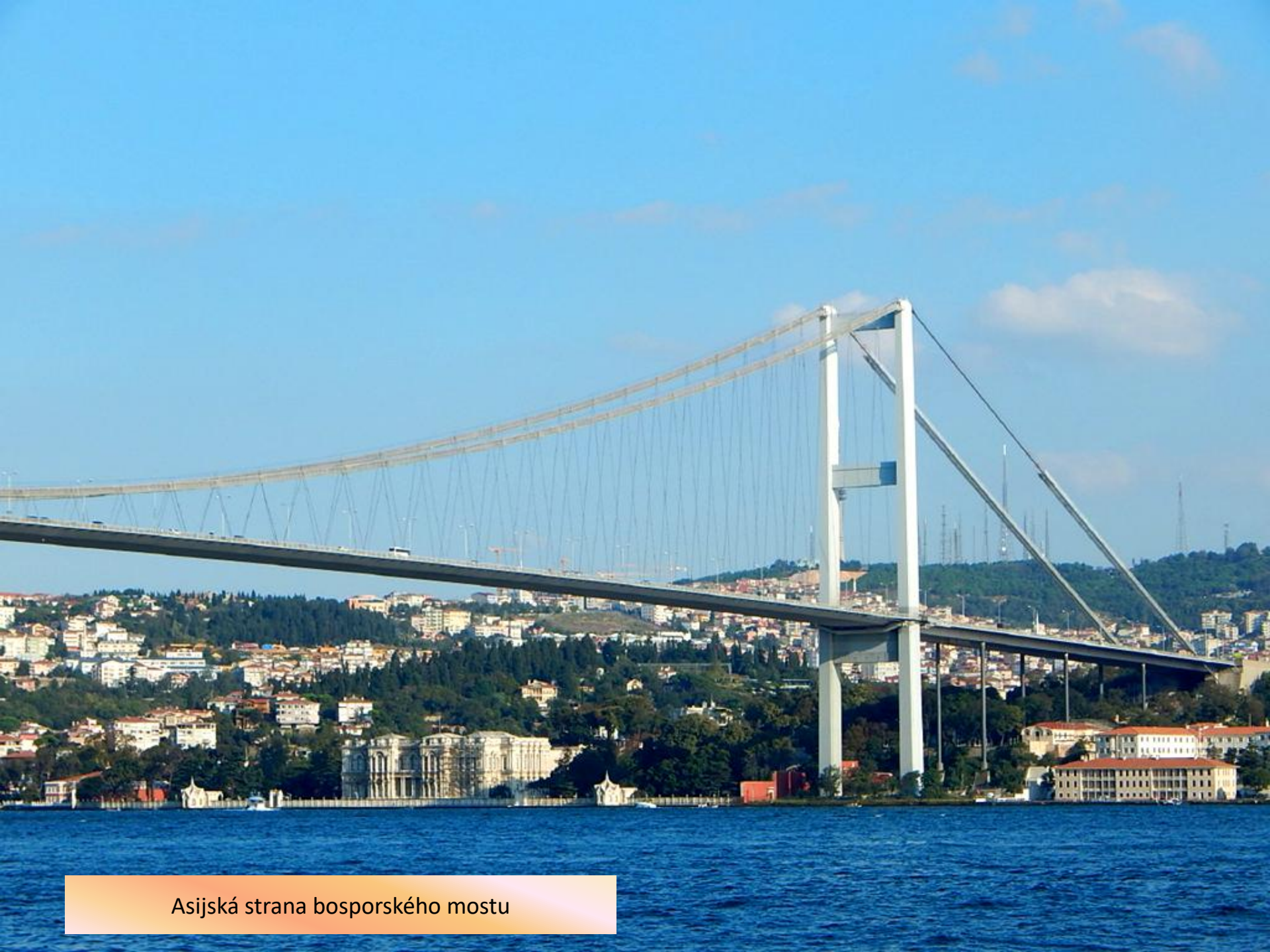
Asijská strana bosporského mostu