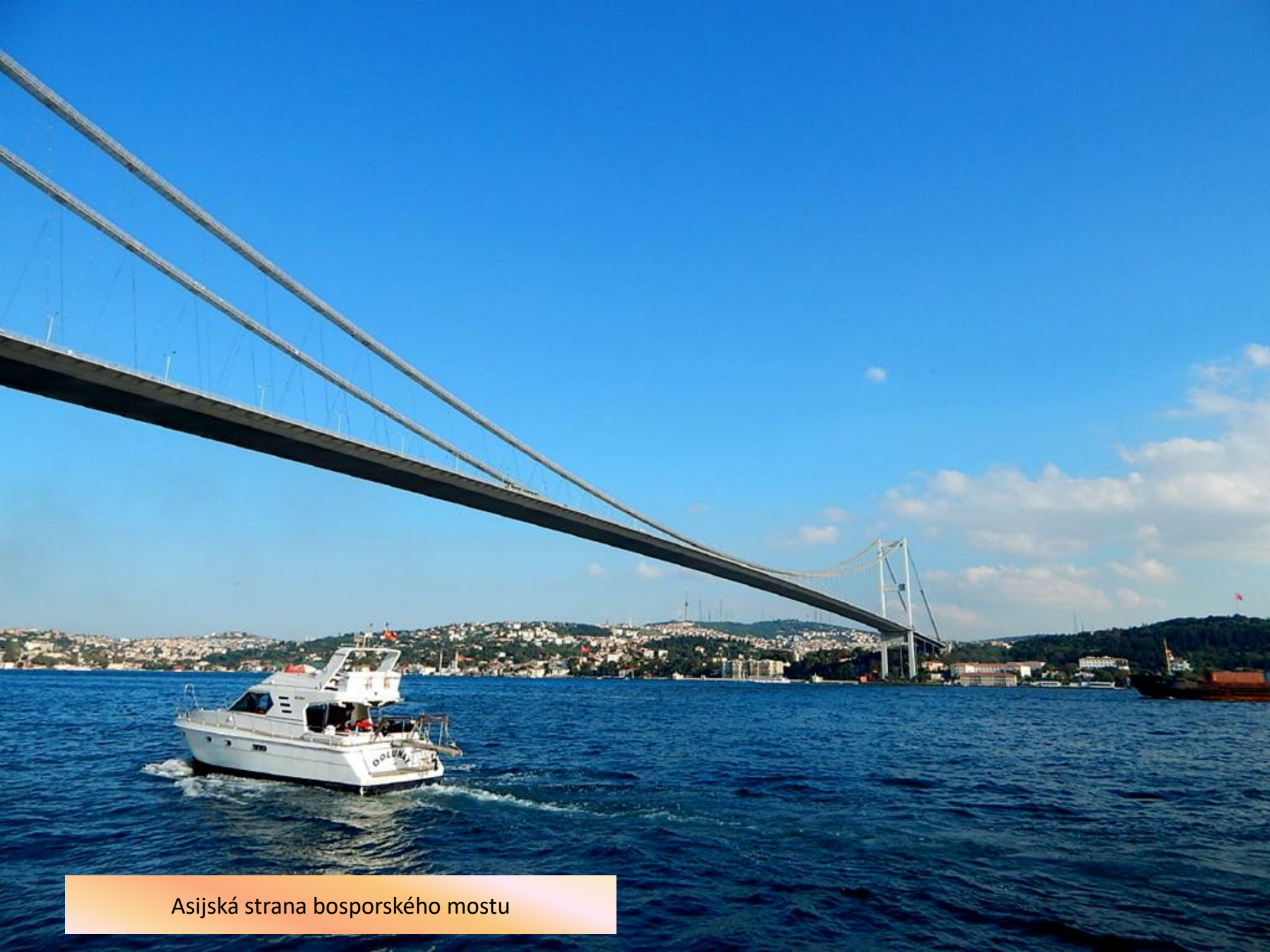
Asijská strana bosporského mostu