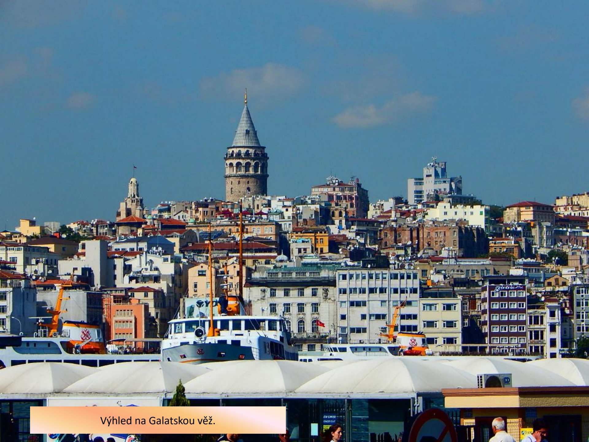
Výhled na Galatskou věž.