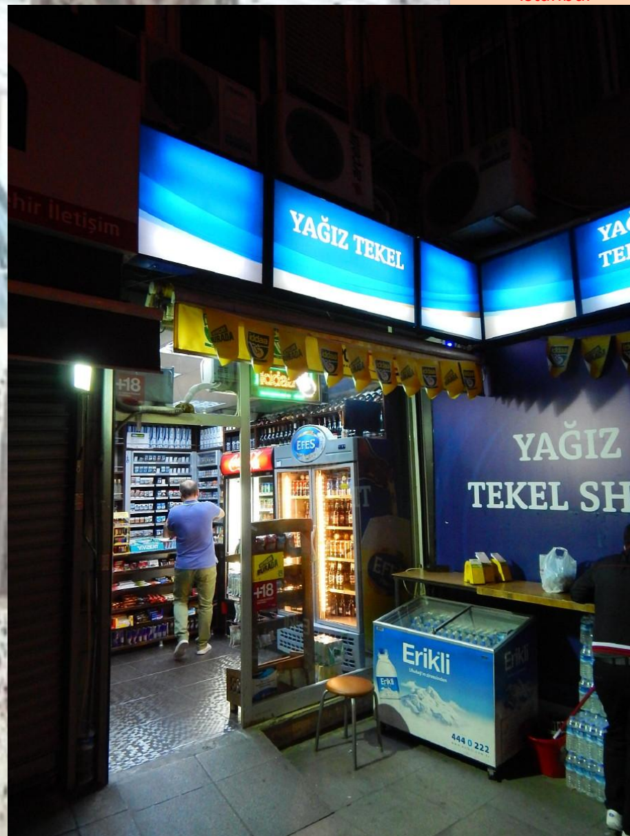
Prodejna nápojů .