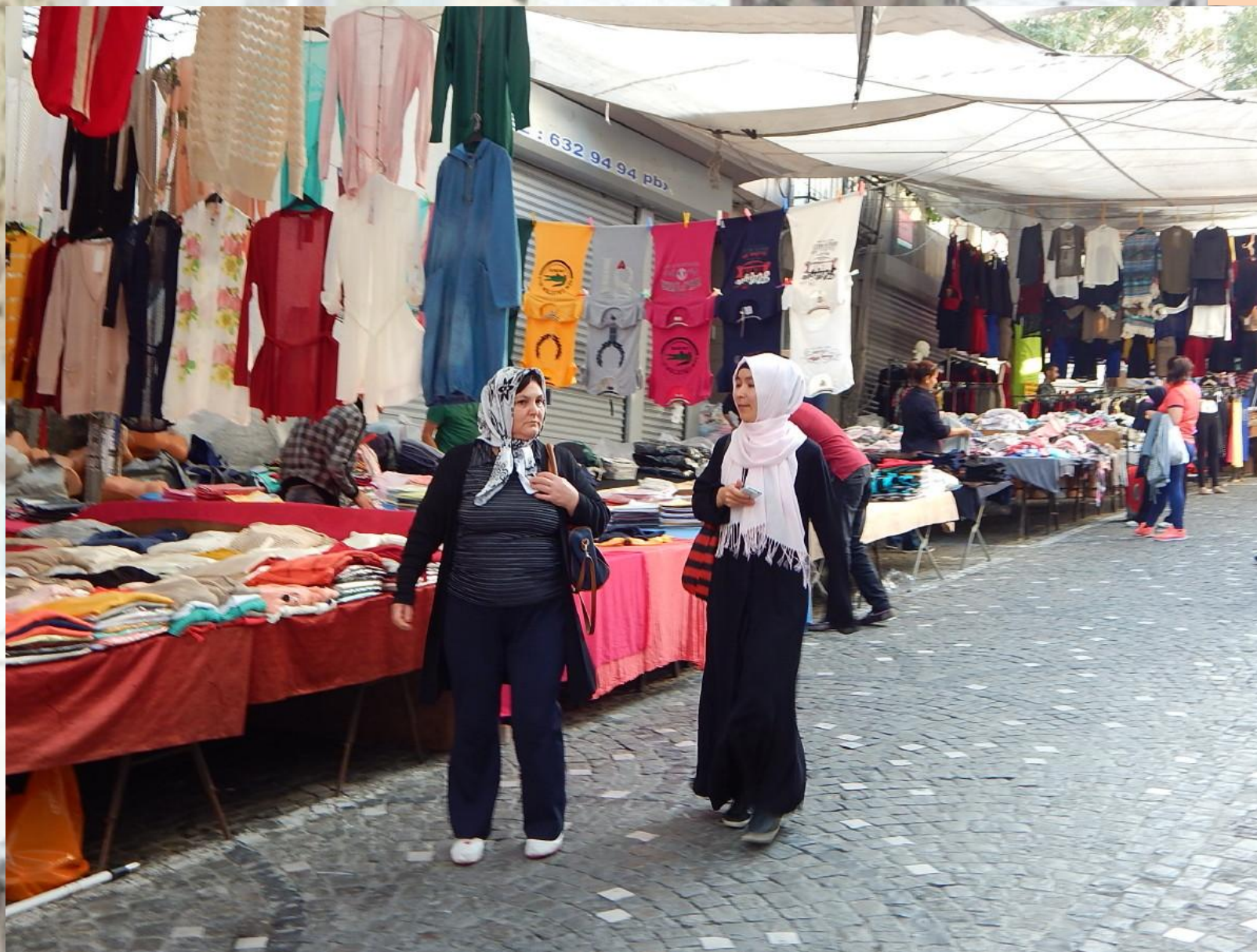
S přítelkyní si nákup žena lépe užije.