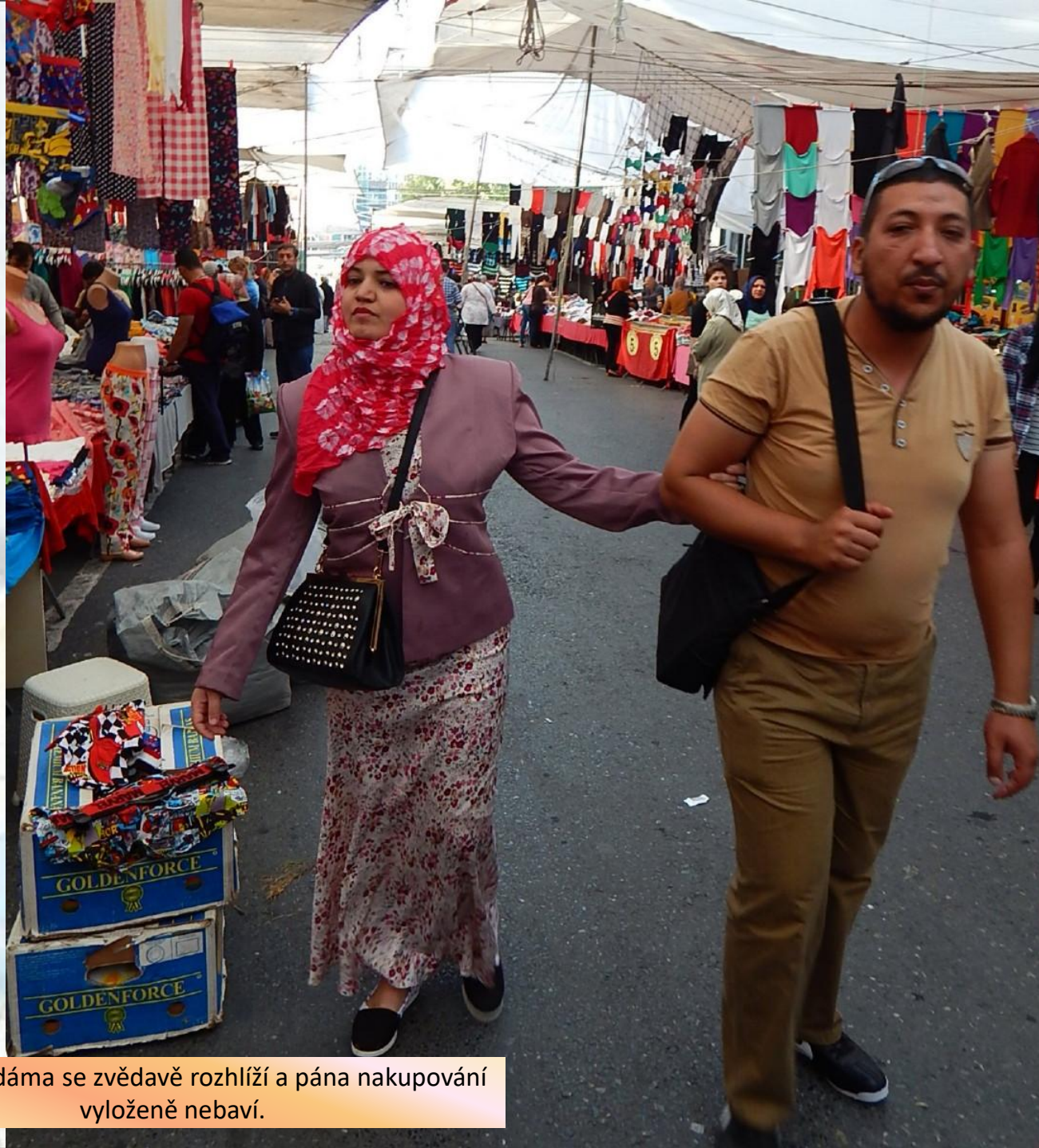
Jako u nás...dáma se zvědavě rozhlíží a pána nakupování vyloženě nebaví.