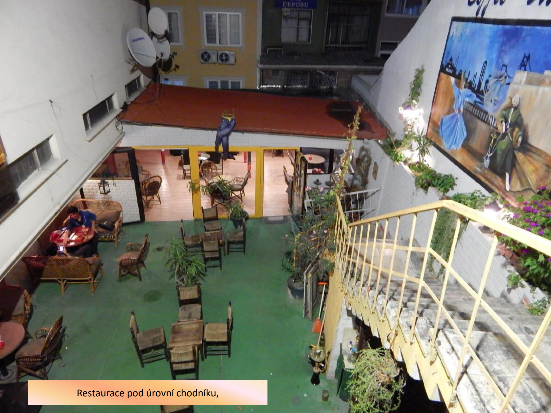
Restaurace pod úrovní chodníku,