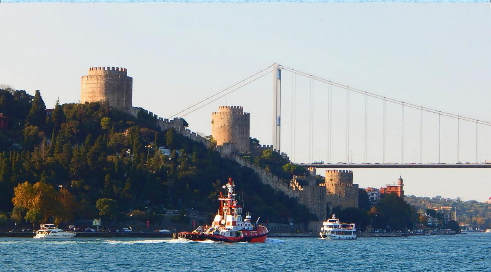
Pevnost Rumeli. Evropský konec druhého mostu přes Bospor.