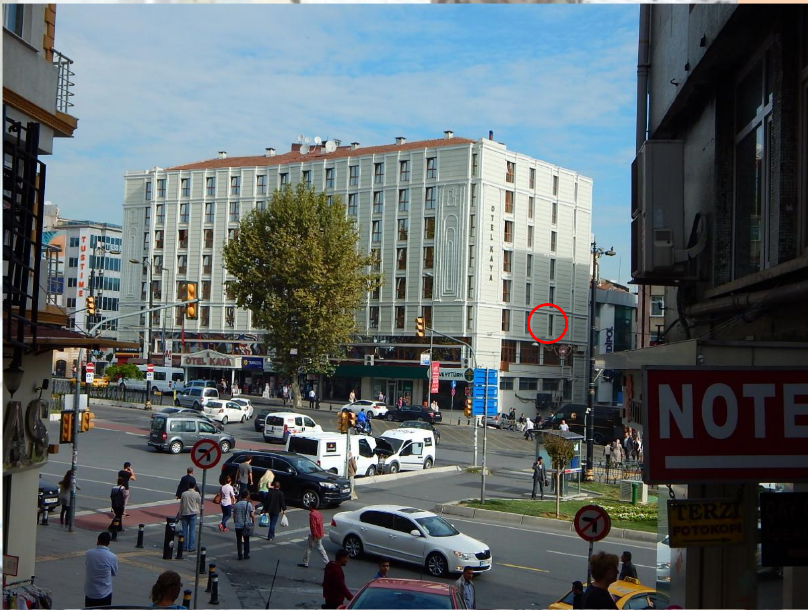
Istanbul / Findikzade / hotel Kaya