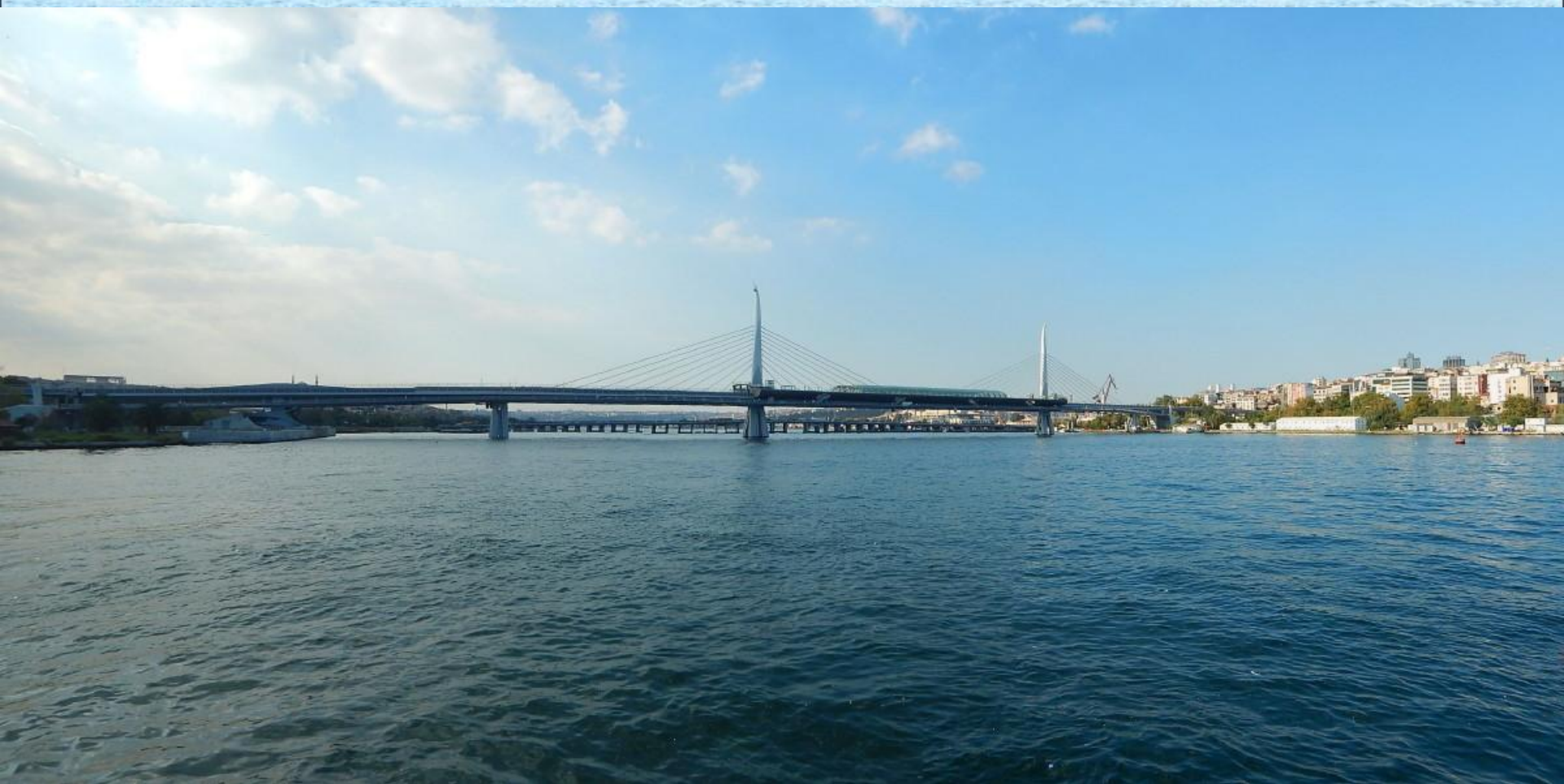
Atatürkův most přes Zlatý roh