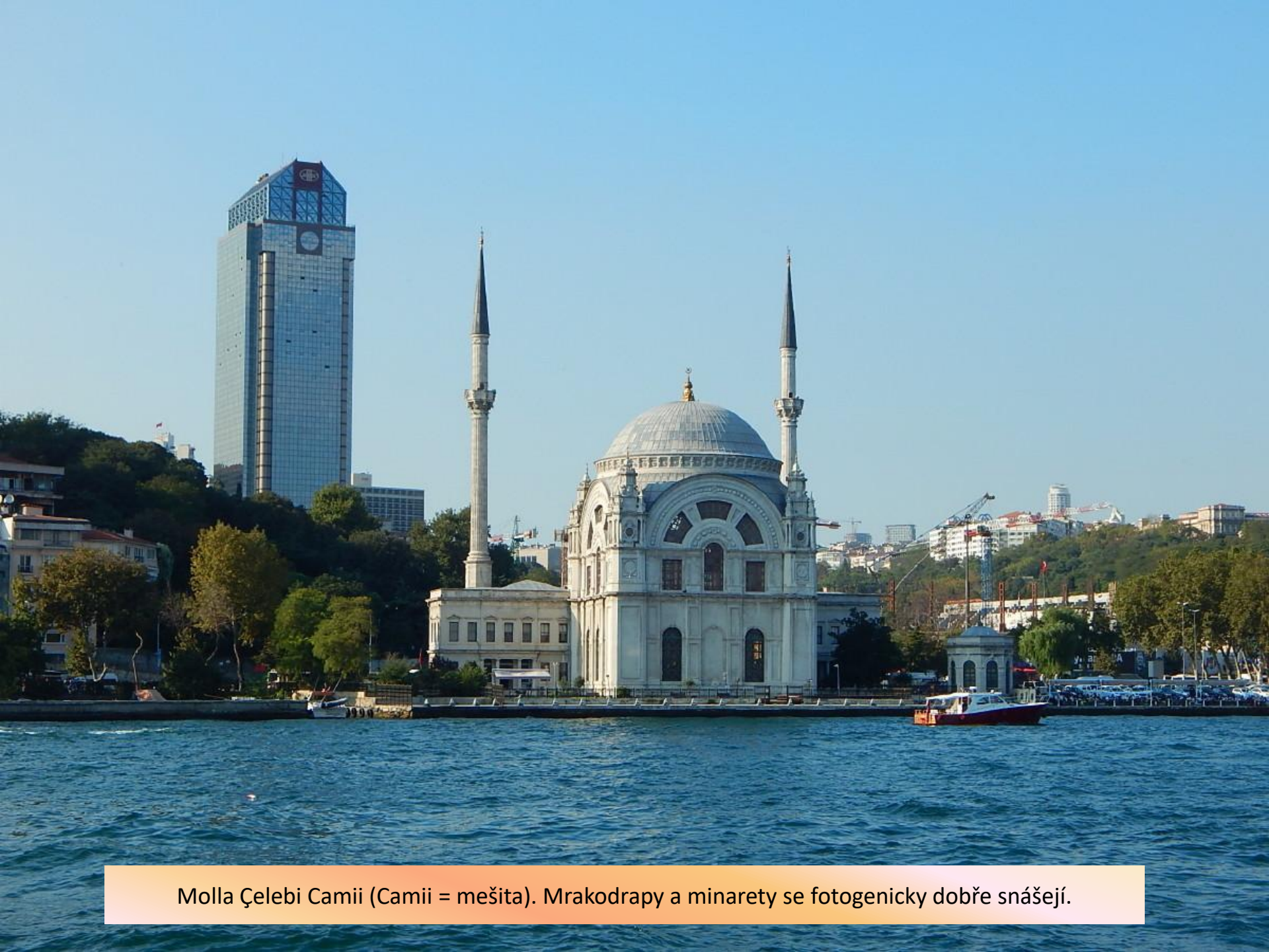
Molla Çelebi Camii (Camii = mešita). Mrakodrapy a minarety se fotogenicky dobře snášejí.