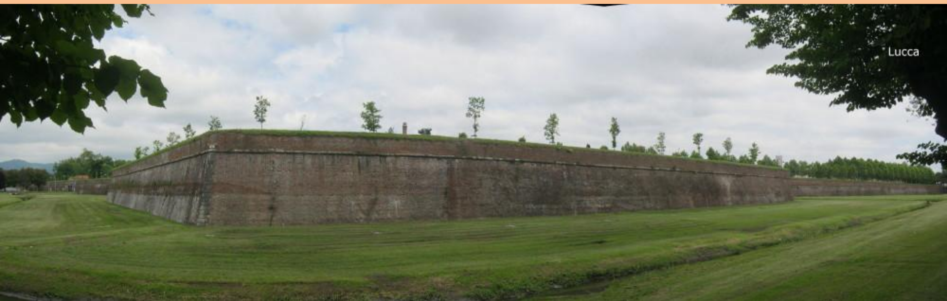
Panoramatický pohled na hradby města