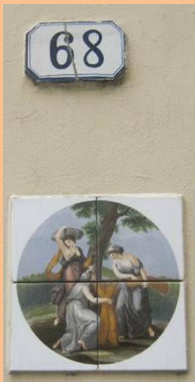
Domovní znamení po italsku