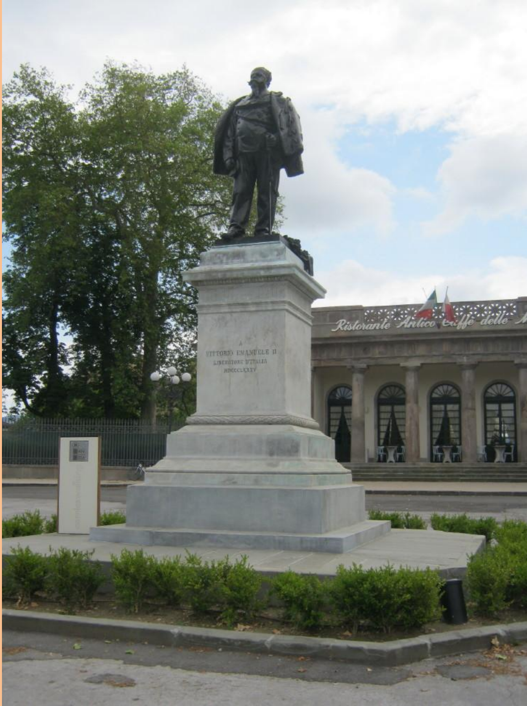
Viktor Emanuel II. Savojský, od r. 1861 první král sjednocené Itálie.