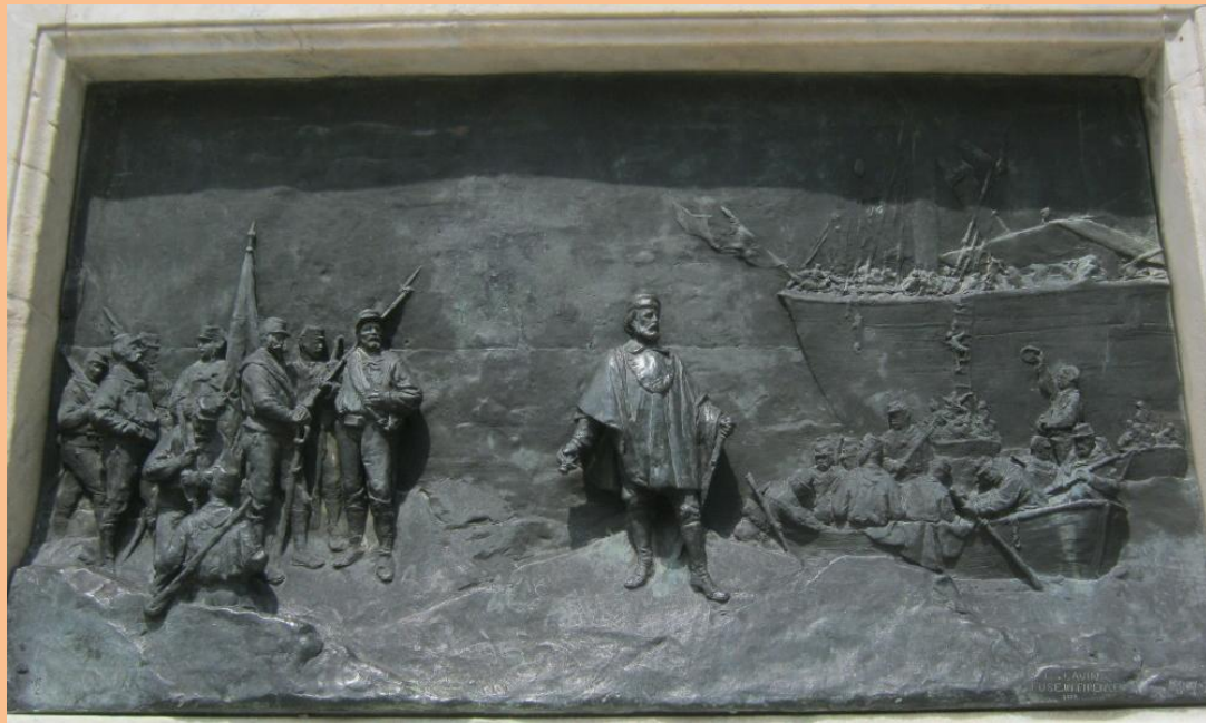
Reliéfy na Garibaldiho pomníku