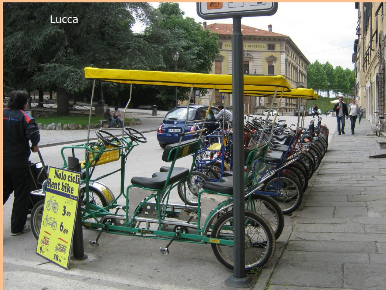
Půjčovna nejrůznějších pohybovadel