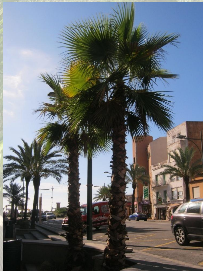
Rušná třída Just Marles Vilarrodona