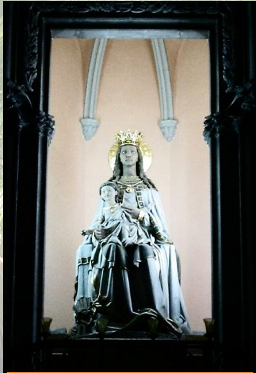
„Černá Madona“ Panna Maria Montserratská či Barcelonská