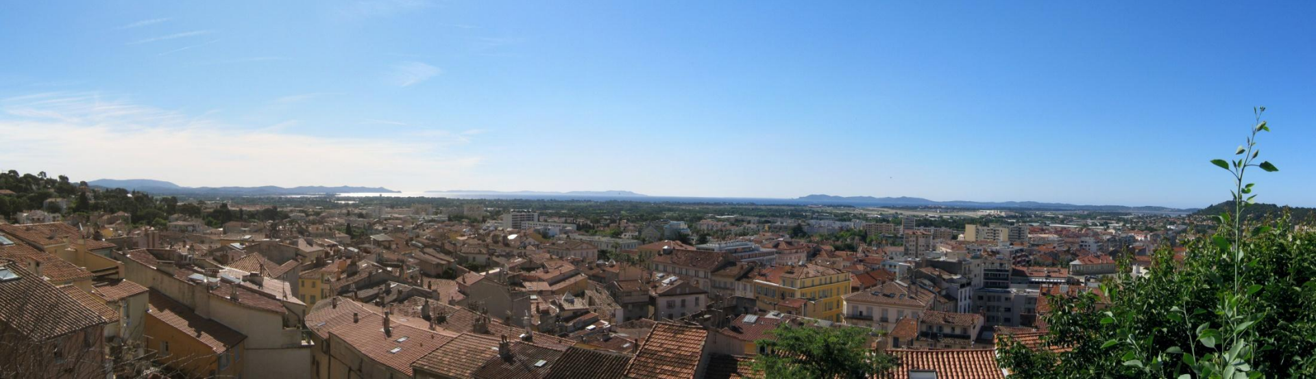
Panorama Hyeres ze starého hradu